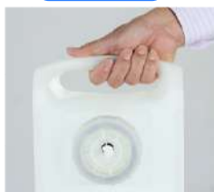
水の交換頻度の目安 給水1回(2タンク分合計15ℓ)あたりの水の交換頻度の目安 ZE132901にて測定。60Hz、室温35℃の場合