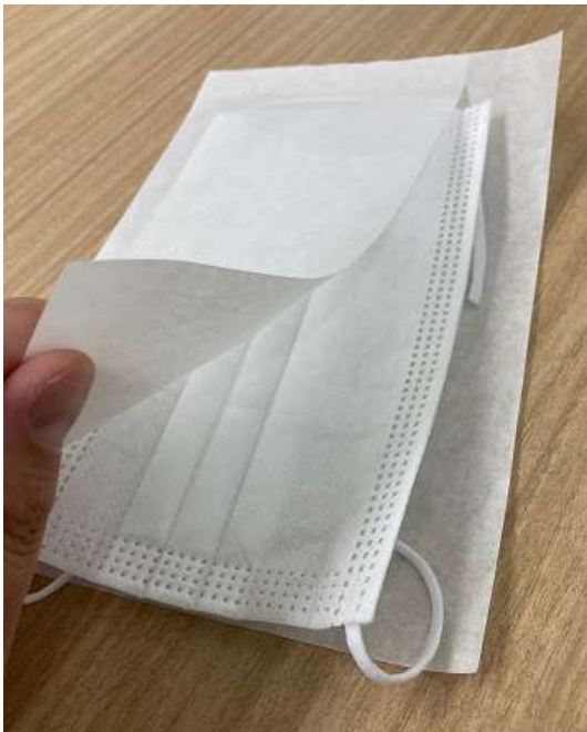
マスク用取り返えシート フレッシュマット